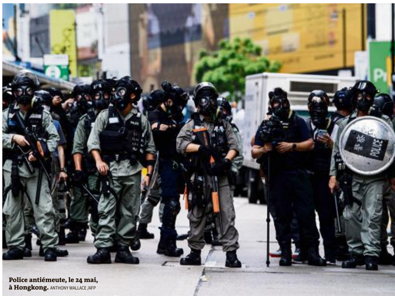
Police antiémeute, le 24 mai, à Hongkong.